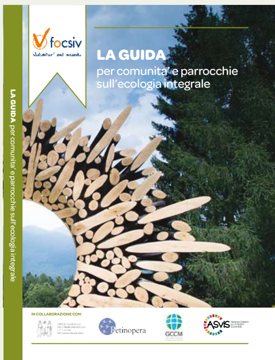
La Guida per comunità e parrocchie sull'Ecologia Integrale 2020 – FOCSIV