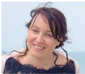
Augelli. Sotto, Assi Al centro, la sede milanese / Marta Carezzi